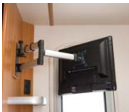
Support mural avec bras articulé pour TV écran plat (selon modèle).