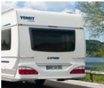
Faces avant et arrière en tôle lisse anti-grêle.