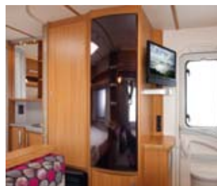
Réfrigérateur Slim Tower 140 litres. Accessibilité optimale et grande capacité (selon modèle).