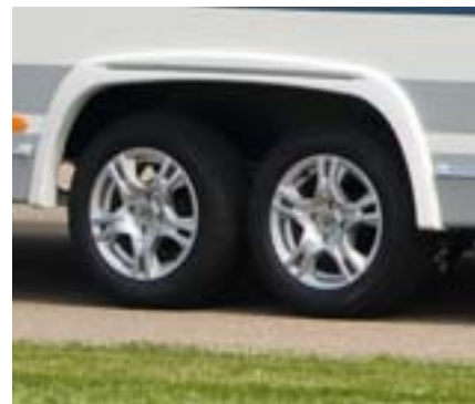
Nouvelles Jantes aluminium.