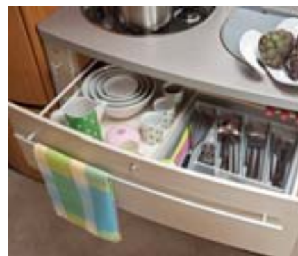
Bloc cuisine avec tiroirs casseroles (dans modèle avec Slim Tower). Espaces de rangement agrandis.

Une caravane Fendt est reconnaissable au premier regard. La ligne extérieure est nette et parfaite, pensée et réalisée dans le pur esprit Fendt-Caravan. L'évolution dynamique aux contours soignés reflète l'interprétation toute personnelle des lignes classiques. Au-delà de l'approche visuelle, l'aspect pratique, la longévité et la facilité de réparation en cas d'accident ont été particulièrement étudiés. La présentation ci-dessus permet, d'un simple coup d'œil, de visualiser nombres de détails extérieurs qui parlent sans aucun doute en faveur de Fendt-Caravan.