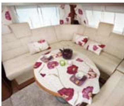
Dimensions généreuses du salon avec env. 40 mm de profondeur d'assise supplémentaire à l'arrière latéral. Circulation d'air optimisée et amélioration du circuit d'air chaud à l'arrière, ventilation anti-condensation renforcée par des aérateurs muraux additionnels.