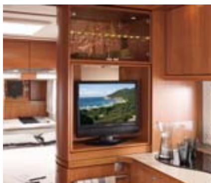
Séparateur d'espace dans cuisine en L (selon modèle) avec élément coulissant dans le bas, avec verrouillage de sécurité et porte-serviette accessible des 2 côtés. Meuble TV télescopique et orientable avec compartiment bar et éclairage LED.