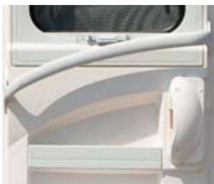
Poignée d'aide à l'entrée – Ergonomique et facilité d'emprise.